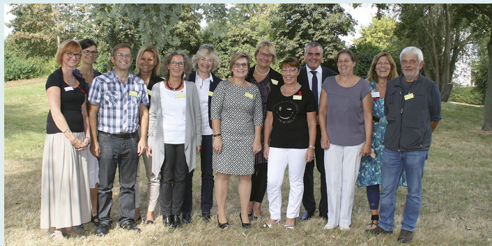
Der Arbeitskreis AIDS / STI Rheinland-Pfalz Nord